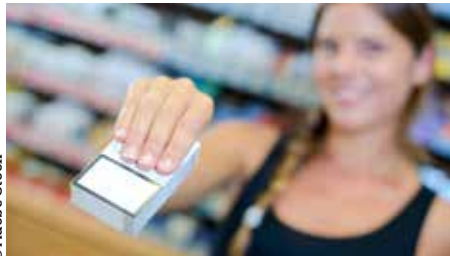
À partir du mois de juillet 2020, les bureaux de tabac d'Indre-et-Loire vont proposer un nouveau service : le paiement de l'impôt.