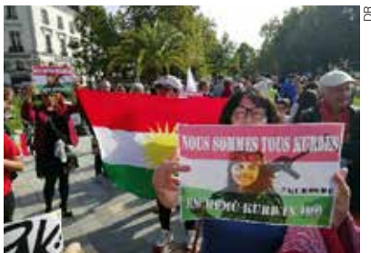
Samedi dernier, environ 200 personnes se sont mobilisées à Tours en soutien au peuple kurde.

La semaine dernière, suite au retrait des troupes américaines, la Syrie a été envahie par les forces militaires de la Turquie. Cette offensive vise à chasser la milice kurde syrienne des zones frontalières, milice qui a œuvré dans la lutte contre le terrorisme ces dernières années. Le bilan provisoire dépasse aujourd'hui la centaine de morts. Entre 150 et 200 personnes se sont réunies, samedi dernier, sur la place Jean-Jaurès pour soutenir le peuple kurde. Parmi elles, plusieurs familles kurdes installées en Touraine sont venues réagir contre « l'injustice » pratiquée contre leur peuple. « L'humanité tout entière est blessée, lance une jeune femme kurde. C'est un devoir moral de nous mobiliser contre toutes les forces qui font du mal à cette humanité. Si on croit en les